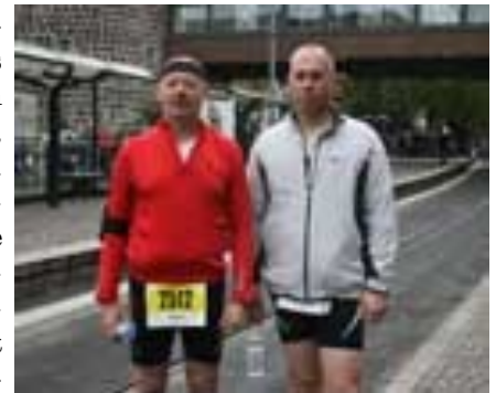
Unser Laufteam in Köln

Schon seit Jahren startet der A.L.T. traditionell einmal im Jahr im Ausland . Heuer ging es ins Rheinland, in die Hauptstadt des deutschen Humors, nach Köln, in das Kölschparadies, welches dann auch ausgiebig genossen wurde. Am Freitag nach der Ankunft auf dem Flughafen Köln-Bonn wurde gleich im Messegelände Deutz die Startnummer ausgefasst. Am Samstag Kölner Dom und Erholung. Sonntag strahlendes Sommerwetter mit bis zu 26°. Der Start war um 11 Uhr angesetzt. Mit etwa 20 Minuten Verspätung, ging es dann vom Platzsprecher gut unterhalten los . Christian begleitete Franz bis zu km 12, von da an lief Franz, dann nur mehr mit etwa 8000 Läufer/innen bis ins Ziel in die Rewe City, auf dem Messegelände von Deutz. Die gewaltige Zuschauerkulisse beim drittgrößten Marathon in Deutschland, auf einem sehr flachen Kurs war dann auch gut für eine recht ansprechende Zeit für unseren letzten A.L.T. Läufer Franz. Die nächsten 2 Tage gab es dann Kultur, Geschichte und Kulinarik pur. Auch im nächsten Jahr wird unser Rumpflaufklub wieder einen Lauf im Ausland (23.01.2011 Gran Canaria ) starten. ( Text: Berglovsky )