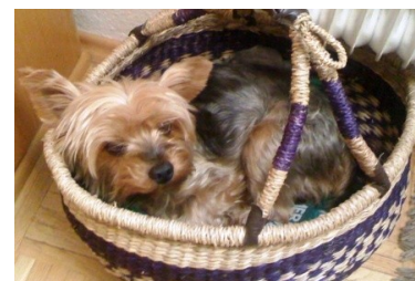
Die besten Genesungswünsche der besten Hundemutti von allen